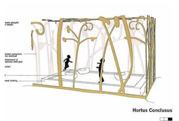
... en 'Hortus Conclusus' evenmin.

in het Spaarneziekenhuis aan de Händellaan in Heemstede.