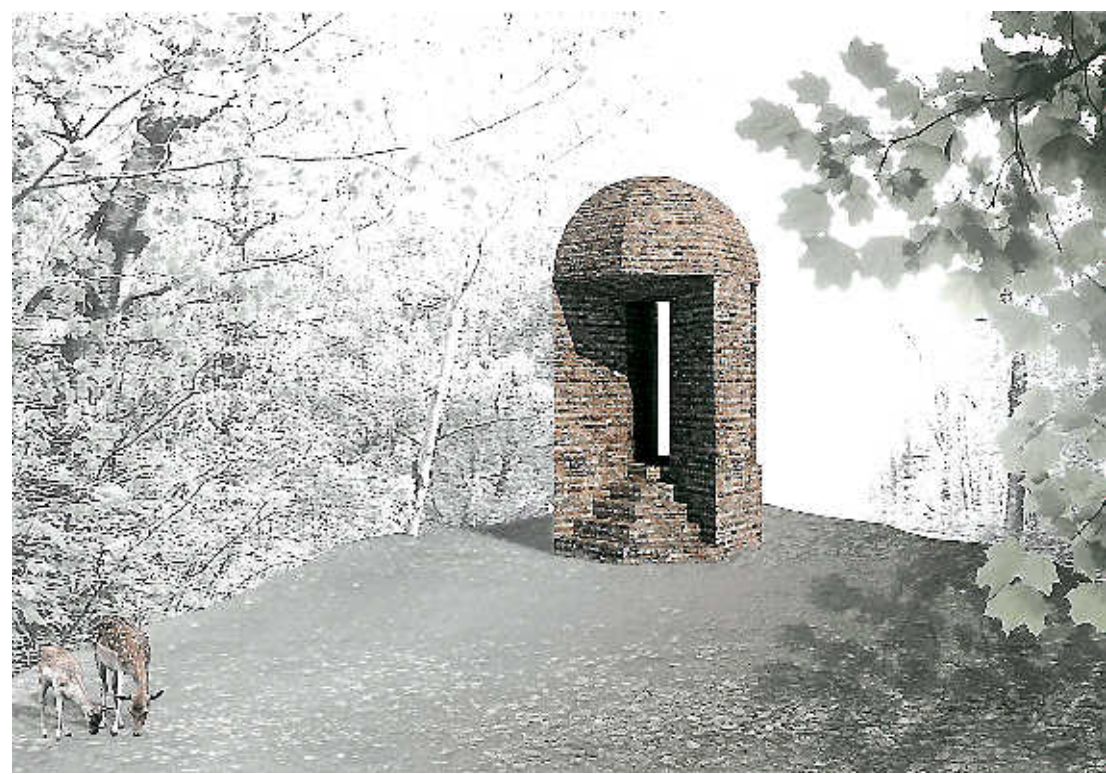
'Mijmer en Focus' heet het winnende ontwerp voor een volledig bakstenen tuindecoratie.