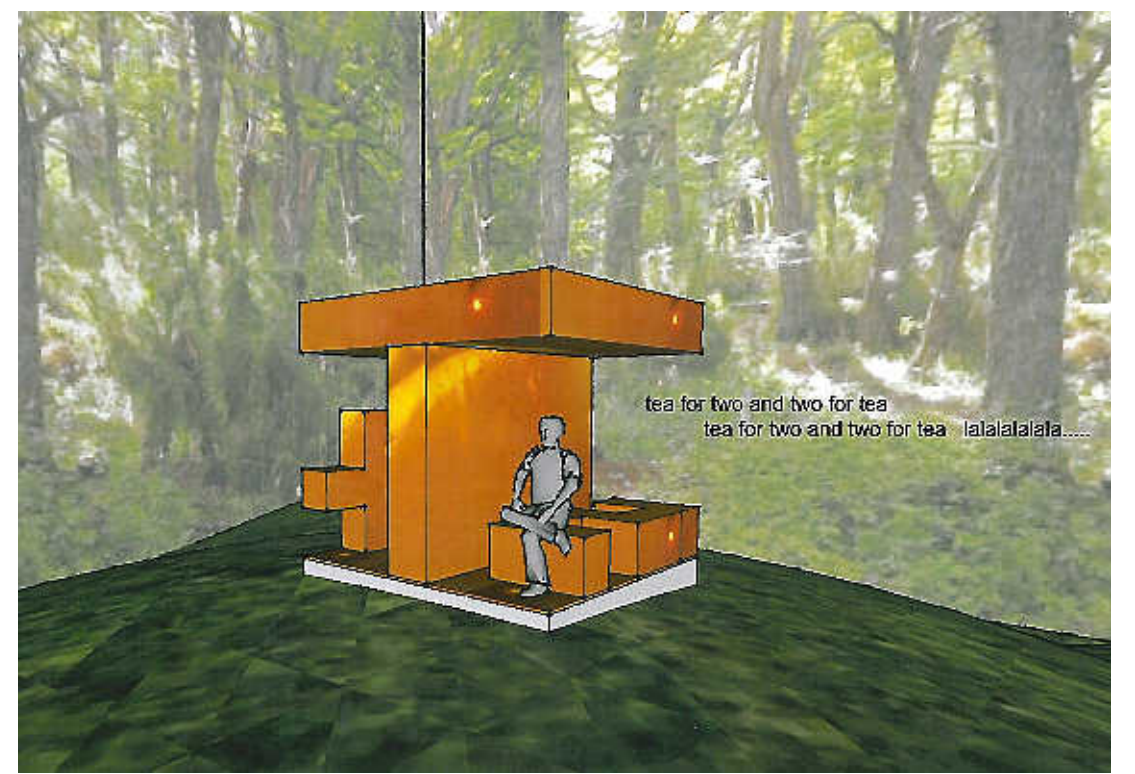
Dit ontwerp haalde het niet: 'Tea for Two'.